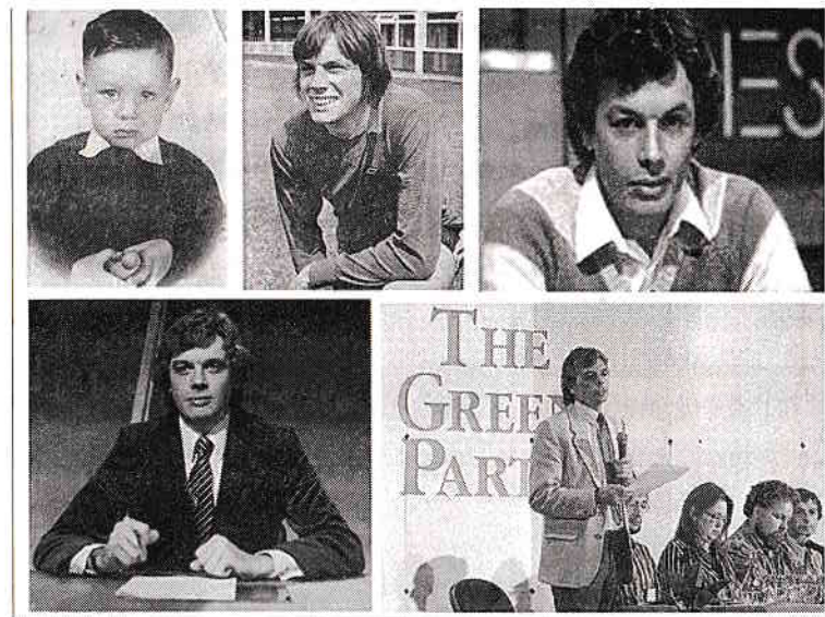
Figura 1: Viața mea părea să fie o serie de evenimente aleatorii până când recurența unui model a devenit greu de negat.

A doua mea opțiune de carieră a fost întotdeauna jurnalismul și acolo m-am îndreptat în continuare. Mi-am propus să devin prezentator de televiziune la departamentul de sport al BBC – deși, dată fiind situația mea, mi s-a spus că acest lucru ar fi aproape imposibil (așa cum mulți au spus și despre intrarea mea în fotbalul profesionist, înșelându-se totuși amarnic). Am părăsit școala la 15 ani pentru a mă alătura echipei Coventry și nu aveam nicio calificare educațională, darmite o diplomă universitară. Mi s-a spus că, prin urmare, accesul în jurnalism va fi foarte dificil. Dar modelul care a funcționat în fotbal s-a repetat și în acest caz prin intermediul mai multor coincidențe și „infuzii de șanse” care m-au condus către ziare, radio, televiziune regională și, în cele din urmă, spre